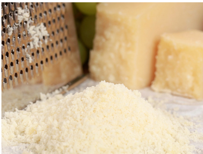
■ Parmigiano Reggiano

Gracias a la reciente colaboración con la sociedad BS de Parma nacieron soluciones innovadoras y creativas para la preparación de lasañas y canelones listos para el consumo. De más de 30 años BS trabaja con competencia y fiabilidad en los principales mercados de comidas prontas, fast food, helados y dulces. Se trata de productos que te permiten de ganar y nosotros te ofrecemos la mejor solución personalizada.