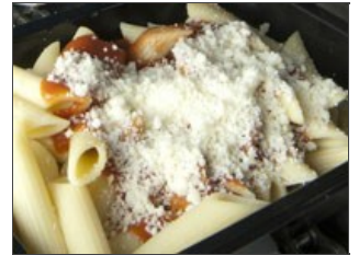
Queso rallado su pasta